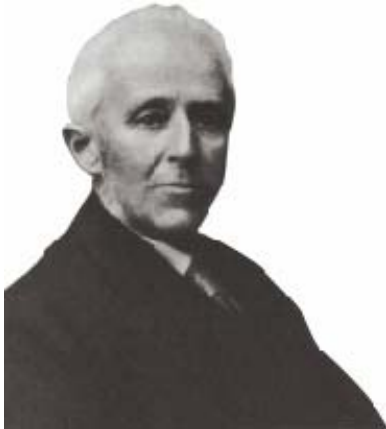
El doctor Joseph Bell, profesor de Doyle.

De todas las personas que conoció en la Universidad de Edimburgo, dos profesores influyeron decisivamente en el joven Arthur. Uno de ellos fue John Rutherford, una impresionante figura, cuya barba y rugiente voz, treinta años más tarde, Conan Doyle utilizaría para su creación del profesor Challenger. El segundo fue una figura clave que impresionó tanto al joven estudiante de Medicina, que le sirvió para dar vida a su personaje más famoso: el detective Sherlock Holmes. Se trataba de Joseph Bell, catedrático de Edimburgo, quien distinguió a Conan Doyle entre sus discípulos, nombrándole su ayudante. La agudeza de Bell para diagnosticar las dolencias y adivinar las circunstancias personales de cada uno de los enfermos impresionó enormemente al futuro escritor, que, como Watson con Holmes, asistía fascinado a las deducciones de su profesor. Con un llamativo físico, alto, delgado, fibroso, con largos brazos y piernas, inquisidores ojos grises y una extraña forma de caminar a saltos, Bell era un hombre brillante en todo lo que emprendía, aparte de un excelente médico a quien le apasionaban la poesía y la ornitología.