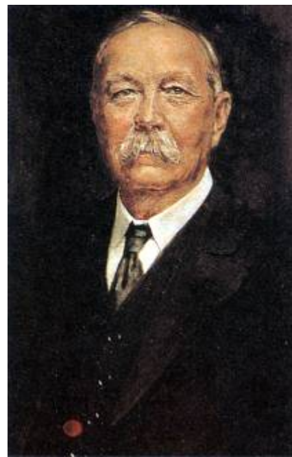
Sir Arthur Conan Doyle, por H.L. Gates.

Resulta curioso que con frecuencia los seguidores y devotos admiradores de un personaje de ficción ignoren la figura de su autor. A menudo, el único mérito que le atribuimos a un autor se reduce a haber creado un mito con el que compartimos aventuras, y limitamos su vida y sus méritos a la creación de nuestro personaje favorito, dejando al margen el resto de sus facetas aunque sean tanto o más importantes y en muchos casos ilustrativas de por qué, cuándo y cómo nació el personaje. En el caso de Sir Arthur Conan Doyle el delito es flagrante: cientos de miles de fanáticos admiradores de Sherlock Holmes, repartidos por todo el mundo, rinden culto a la criatura, olvidando al creador y sus otras interesantes actividades como historiador, periodista, gran deportista y uno de los grandes impulsores del espiritismo como alternativa de la existencia de otra vida después de la muerte.