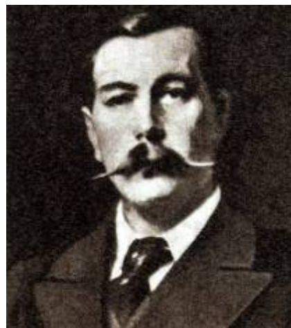
Retrato de juventud de Conan Doyle.