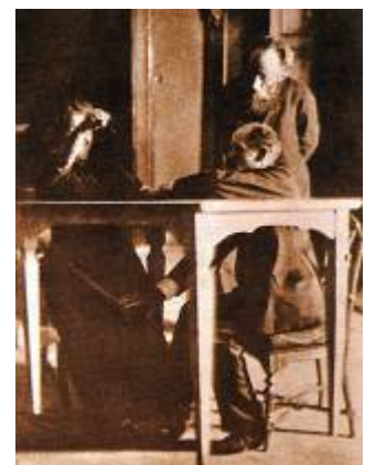
Dos científicos controlan a la médium durante una sesión de espiritismo.

Kathleen Goligher era capaz de mover una mesa con el ectoplasma que producía durante las sesiones, y Crawford había