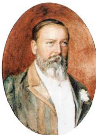
Retrato del reconocido médium y estudioso de fenómenos espiritistas William Stainton Moses.