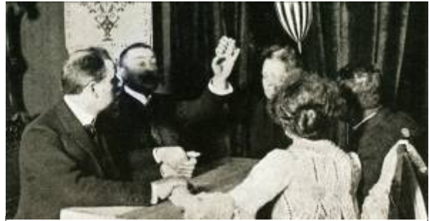
Eusapia Palladino había levitar una mandolina.