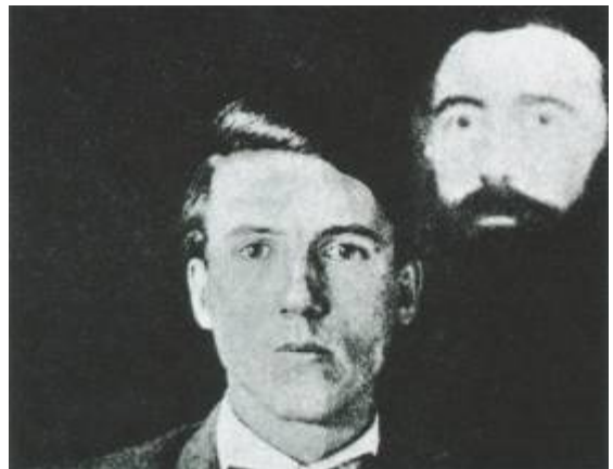
Fotografía de un médium junto a un pariente fallecido de uno de los asistentes a la sesión.

Durante su estancia en Australia Conan Doyle se interesó por una serie de fotografías que atestiguaban "presencias" durante las sesiones. Doyle envió las fotos a Sir Oliver Lodge, a Inglaterra, y tomó la decisión de investigar seriamente sobre el tema a su regreso. Aquellas fotos, llenas de hadas y elfos, abrían una nueva e interesante perspectiva. Más tarde sería muy criticada la ingenuidad del escritor por aceptar unas fotos que no admitían el más elemental análisis. Desde Australia, los Doyle se dirigieron a Nueva Zelanda, donde Sir Arthur tuvo una cálida acogida. Tras visitar Sri Lanka