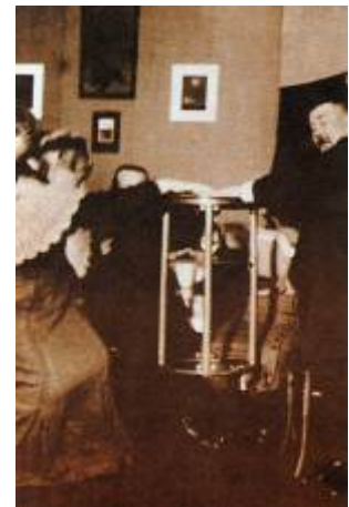
En el transcurso de una sesión, Eusapia Palladino lograba que la mesa levitase.

La comprobación de que algunos médiums eran capaces de producir un extraño plasma que fluía desde ellos, moviéndose y adoptando diferentes formas, algunas de ellas humanas, revolucionó a los medios espiritistas. Los investigadores tomaban todo tipo de precauciones antes y durante las sesiones para evitar posibles fraudes. Crawford, en el caso de Kathleen Goligher, hacía que una enfermera observase cada uno de los orificios de la joven, hasta los más íntimos, ya que en algunos casos el ectoplasma parecía proceder de la vagina. La médium debía desnudarse y utilizar sólo prendas de vestir previamente analizadas, que no permitieran ocultar ningún truco; y finalmente, las sesiones eran fotografiadas. Conan Doyle había visto algunas fotos que Crawford había hecho a Kathleen Goligher en las que se podía ver la creación de ectoplasma, y el escritor estaba fascinado. Viajó a Irlanda del Norte para entrevistarse con Crawford y poder comprobar por sí mismo los descubrimientos que convertían aquello en una , mezcla de ciencia y teología. En 1920 Crawford hizo un resumen de sus investigaciones en un libro titulado The Psychic Structures at the Goligher Circle , que se publicó después de su muerte.