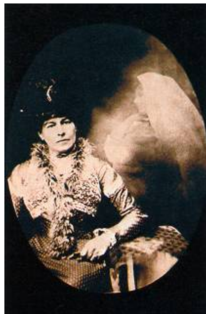
En la fotografía se puede observar el ectoplasma de una médium, que ha adoptado la forma de una figura humana.

El plasma surgía de sus dedos, pezones, vagina y, en algunas ocasiones, del interior de la boca. El ectoplasma crecía y se reducía a voluntad, llegando en algunos casos a adoptar forma de rostro e incluso figuras humanas. Es justo lo que Conan Doyle esperaba. En este caso, todos los asistentes podían ver con toda claridad los fenómenos producidos durante las sesiones. Este convencimiento le animó a emprender la gran cruzada que llevó a cabo pertinazmente durante lo que le quedaba de vida.