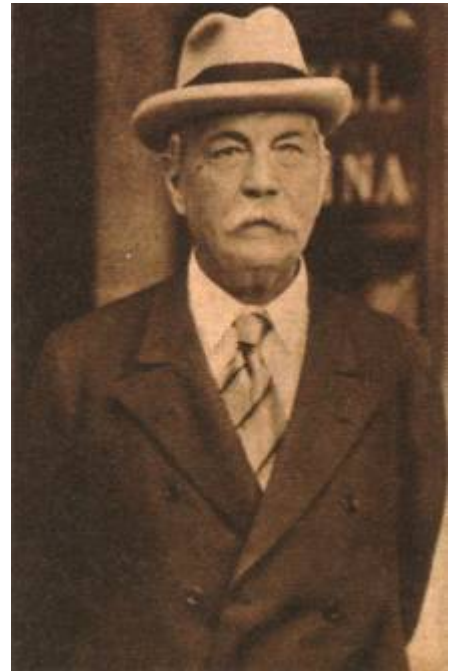
Sir Arthur Conan Doyle, al final de su vida. A pesar de su delicada salud, mantuvo hasta el último momento su espíritu aventurero.