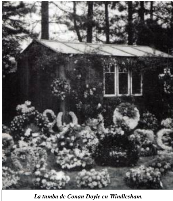
La tumba de Conan Doyle en Windlesham.

El día 7 de julio de 1930, Sir Arthur Conan Doyle entregó su alma mientras contemplaba los pájaros del jardín desde la ventana de su dormitorio, sentado en su sillón favorito. Para su familia fue como si se hubiese dormido. Él seguía allí con ellos. De acuerdo con los expresos deseos del escritor, el funeral se celebró en Windlesham, la casa familiar de Crowborough, en la mayor intimidad. La familia recibió miles de mensajes de condolencia de todo el mundo. Desde jefes de Estado e ilustres artistas hasta los más modestos lectores de las aventuras de Sherlock Holmes, todos querían dar su testimonio de aflicción por la muerte de un hombre bueno. Aunque sus numerosos detractores le habían tildado de tozudo, ingenuo y otros epítetos, jamás nadie puso en duda su mayor virtud: la bondad. Como un personaje de una de sus novelas, Sir Arthur Conan Doyle había dado su último saludo en el escenario.