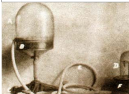
Harry Price utiliza diferentes instrumentos durante las sesiones de espiritismo, como este telekinoscopio de su invención.