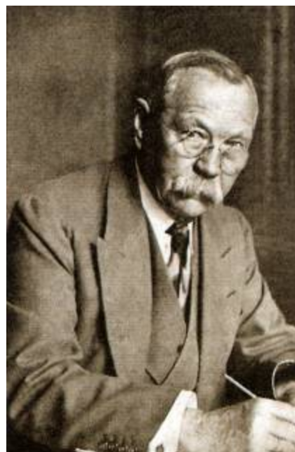
Sir Arthur Conan Doyle, en 1929, en su residencia de Windlesham. La salud del escritor estaba ya seriamente quebrantada.

Pasaban los años y Conan Doyle aceptaba apaciblemente su paso. Tenía una esposa a la que amaba profundamente, le encantaban sus hijos, y su profesión iba viento en popa. En 1921 había estrenado con gran éxito la obra en un acto The Crown Diamond: An Evening with Sherlock Holmes , con Dennis Neilson-Terry en el papel del detective, y la compañía partió para una gira de larga duración. Ese mismo año publicó el relato titulado La piedra preciosa de Mazarino -basado en la obra de teatro The Crown Diamond -, que alcanzó el éxito acostumbrado. Al año siguiente, en 1922, John Murray publicó una colección en seis volúmenes con los relatos no holmesianos de Sir Arthur: Tales of the Ring and Camp , Tales of Pirates and Blue Water , Tales of Terror and Mystery , Tales of Twilight and the Unseen , Tales of Adventure and Medical Life y Tales of Long Ago . Aunque no era un jovencito, Conan Doyle poseía una salud y energía envidiables, que le permitían dedicarse en cuerpo y alma a sus actividades favoritas. Viajaba, trabajaba en sus novelas y tenía tiempo y ganas de embarcarse en defensa de toda causa que le pareciese justa y digna.