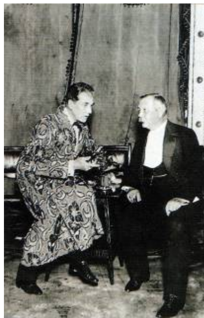
Conan Doyle conversando con el actor Ellie Norwood, genial intérprete de Sherlock Holmes, en 1921.

Con el transcurrir de los años, Conan Doyle estaba cada vez más convencido de la verdad de sus creencias. La construcción de la biblioteca y el museo, que dirigía personalmente, le habían convertido en una autoridad. Su compromiso y moderación hacían que muchas personas de todo el mundo contactasen con él para contarle experiencias propias y ajenas. Los más importantes médiums y espiritistas ansiaban conocer a Conan Doyle, en parte por su dedicación al espiritismo, y en parte porque era muy rico y además, lo que es más raro, generoso. Sin embargo, sus comentarios y escritos resultaban casi siempre polémicos. Sus detractores entendían que sus ideas iban en contra de la religión, y que para creer en la otra vida hacía falta fe, en vez de estrambóticas sesiones con duendes y espíritus. Pero en las propias filas del espiritismo había personas que, por miedo a lo desconocido o para evitar que las cosas perdiesen su proporción, se convertían a veces en auténticos y terribles fiscales.