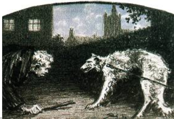
Ilustración de Steel para la publicación, en 1923, del relato El Hombre que reptaba .

En 1927, John Murray, en Gran Bretaña, y George H. Dorar, en Estados Unidos, publicaron The Casebook of Sherlock Holmes ( El archivo de Sherlock Holmes ), que reunía las últimas aventuras que Conan Doyle había escrito sobre el detective de Baker Street. Además de los ya citados, La piedra preciosa de Mazarino y El hombre que reptaba , incluía: El cliente ilustre , El soldado de la piel decolorada , Los tres gabletes , El vampiro de Sussex , Los tres Garrideb , El problema del puente de Thor , La melena de león , La inquilina del velo , La aventura de Shoscombe Old Place y El fabricante de colores retirado . En el prefacio, Conan Doyle explicaba que había llegado la hora de que el señor Holmes desapareciera. Tres generaciones habían disfrutado de sus aventuras pero -comparándolo con los grandes tenores- le había llegado la hora de dar su último saludo en el escenario.