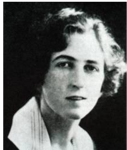
Fotografía de la gran médium Stella Cranshaw, más conocida como Stella C., hacia 1920.

Una de las cosas más sorprendentes de Stella era la placidez que mantenía durante las sesiones.