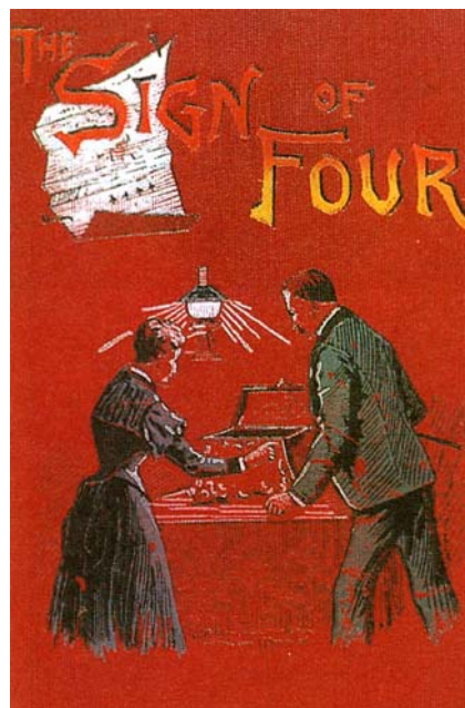
Portada de la segunda edición de El Signo de los Cuatro.

Finalizada la cena, Wilde se comprometió a escribir un libro que se titularía El retrato de Dorian Grey y, por su parte, Conan Doyle firmó el contrato con "Lippincott's Magazine" de lo que sería The Sign of Four ( El signo de los cuatro ), al precio de cien libras esterlinas. El hecho de que el contrato se redactase ese mismo día demuestra la expectación con la que el público estadounidense esperaba una nueva aventura de Sherlock Holmes. El signo de los cuatro se publicó en el "Lippincott's Magazine" en febrero de 1890; poco después, apareció en forma de novela. Al final del libro, la protagonista, Mary Morstan, se convierte en señora Watson, alterando con ello la idílica y confortable relación del doctor Watson con Sherlock Holmes. El libro ganó rápidamente el favor del público, y fue un gran éxito de ventas. Pero empezaba entonces la gran tragedia de Conan Doyle, que veía cómo crecía la popularidad del detective, eclipsando la de su autor; esto provocaba una ambigua relación de amor y odio de Conan Doyle hacia su famoso detective.