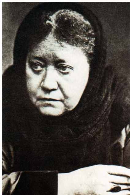
La famosa espiritista Madame Blavatsky.