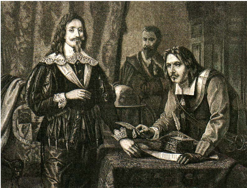
Oliver Cromwell fue uno de los personajes históricos favoritos de Sir Arthur Conan Doyle.

El novelista, una vez más, y a pesar de la innegable calidad de Micah Clarke , tuvo que luchar con varios editores y armarse de paciencia, hasta que logró publicarlo. Pero los malos tiempos iban a cambiar y, como a tantos otros, la fortuna le vendría de América.