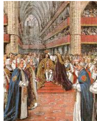
Coronación del rey Eduardo VII en la catedral de Westminster.