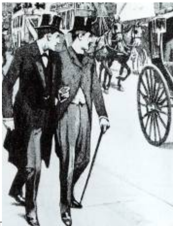
Ilustración de Sidney Paget para El perro de los Baskerville.

ya también en los años siguientes, Arthur Conan Doyle se había convertido en una figura pública. Su fama alcanzaba a personas que jamás habían leído nada de Sherlock Holmes. Los políticos habían empezado a mirar con cierto interés al famoso escritor que, además, se interesaba vivamente por los asuntos públicos y por la política.