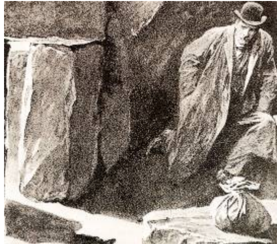
En un momento de la narración de El perro de los Baskerville , Watson observa cómo alguien se acerca al escondite que ha descubierto.