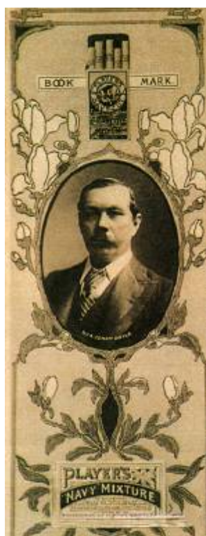
Conan Doyle en un anuncio de cigarrillos Player's.

El éxito del montaje teatral de The Speckled Band ( La banda de lunares ) hizo que se olvidara rápidamente de las críticas negativas a La boda del brigadier . La obra se representaba en el teatro Adelphi y fue el gran éxito de la temporada, alcanzando las 346 representaciones. El inquieto Doyle estaba encantado con este nuevo experimento que le liberaba de la monotonía de sus habituales trabajos literarios.