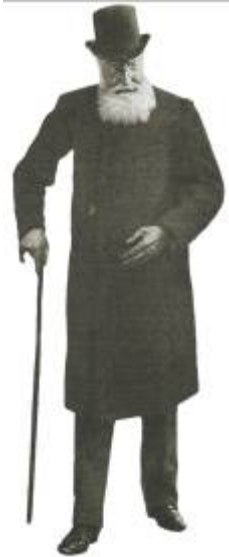
El rey Leopoldo II de Bélgica, cuya política sobre el Congo fue duramente criticada por Conan Doyle.

continente. Le interesaba particularmente la evolución de los diferentes países y las sanguinarias guerras tribales que asolaban muchas de las etnias africanas. Los europeos que tenían intereses en África consideraban que no sólo tenían el derecho, sino también el deber de colonizar sin ningún miramiento aquellas tierras. Sólo estaba bien aquello que favorecía a sus intereses, y para nada contaban los deseos ni los intereses de las diferentes etnias que poblaban el continente. El hombre blanco ejercía con deleite la labor de depredador. El rey Leopoldo II de Bélgica estaba empeñado en fundar un imperio en el Congo desde mediados de la década de 1880, y los belgas llevaban a cabo su tarea enfrentándose con sus rivales portugueses y franceses. Tras muchas discusiones y acuerdos, se creó un estado que no pertenecía a Bélgica, pero cuyo jefe de estado era el rey de Bélgica. Los habitantes del Congo no rendían pleitesía a Bélgica como nación, pero sí a su rey, que era monarca del Congo. Leopoldo II se había adueñado de un país que poseía dos productos que interesaban sobremanera a Bruselas: el caucho y el marfil.