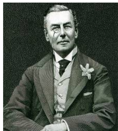
Joseph Chamberlaine, alma del partido unionista secundó las críticas de Doyle por el duro trato que recibían los nativos afroamericanos en el Congo y en Sierra Leona.

Desoyendo los consejos de su esposa, así como los de su agente y editores, Conan Doyle emprendió su particular cruzada en pro de los indefensos habitantes del Congo. Colaboró estrechamente con Roger Casement, cónsul británico en Boma, y con E. D. Morel, un responsable consignatario de buques, con los que trabajaba en una asociación que abogaba por la reforma del Congo y el fin de las atrocidades que allí se cometían. La asociación logró el apoyo del Parlamento inglés, que lanzó un mensaje pidiendo el apoyo de las demás naciones. Todo el mundo hablaba incansablemente, pero nadie tomaba medidas concretas. Conan Doyle estaba indignado. Mientras los políticos se entretenían con inútiles discusiones que no llevaban a ninguna parte, los nativos seguían muriendo en el Congo,