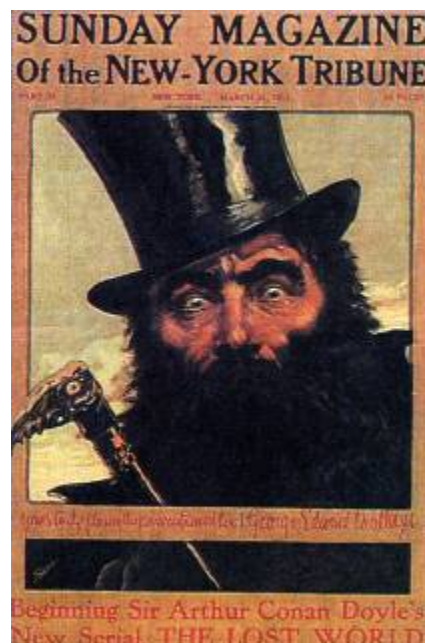
Portada del dominical del "New York Tribune" con el anuncio de la publicación de The Lost World .