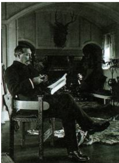
Sir Arthur en Windlesham, en 1912.